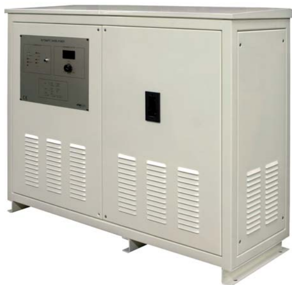
Automatic Shore Power One universal input 50kVA output